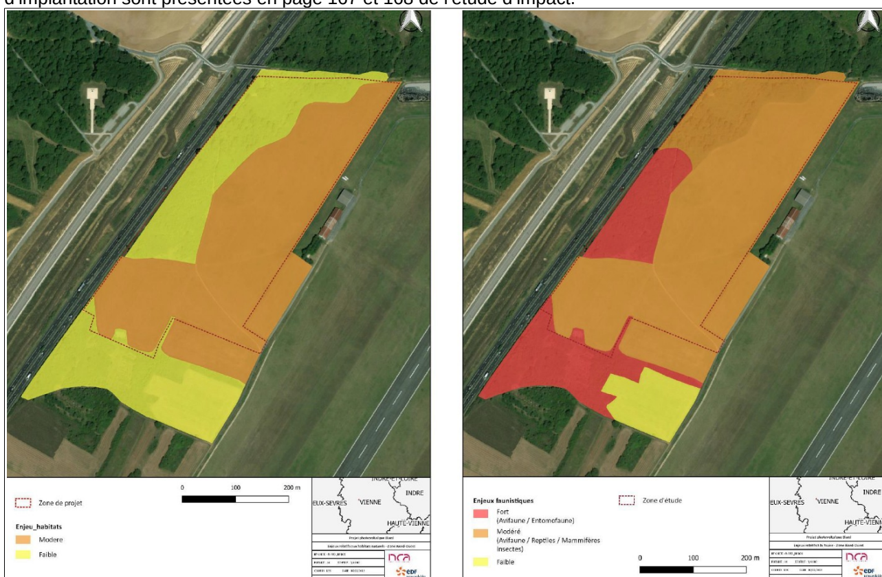
Zone Nord ouest – enjeux habitats naturels extrait page 167 de l'étude d'impact

Les cartographies des enjeux hiérarchisés (faible en jaune, modéré en orange et fort en rouge) du site d'implantation sont présentées en page 167 et 168 de l'étude d'impact.