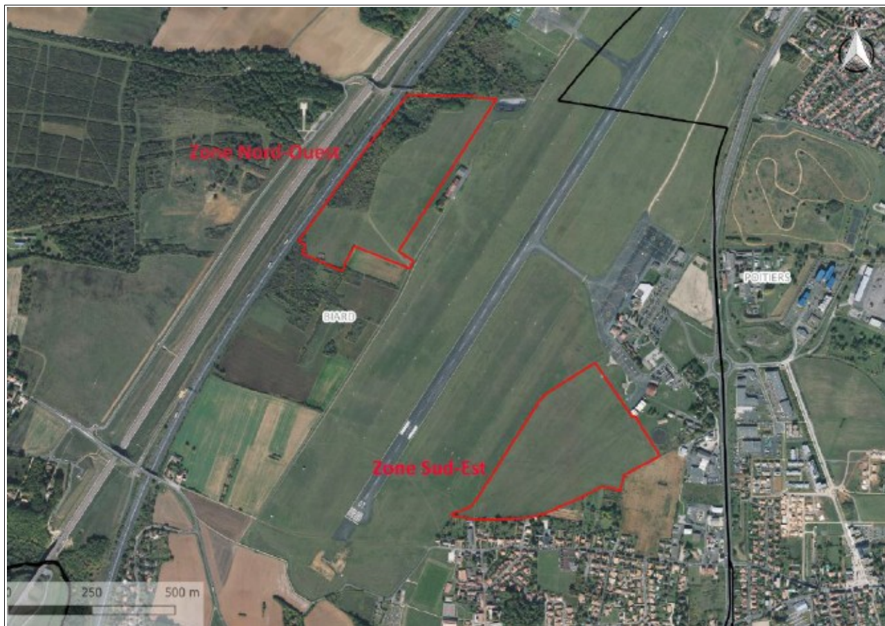
Localisation du projet – extrait étude d'impact page 18

La localisation du projet est présentée ci-après.