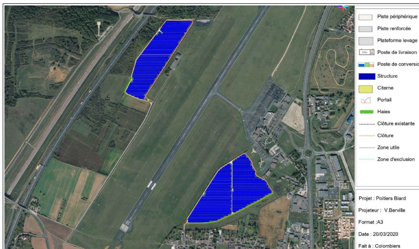
Variante n°2 retenue – extrait étude d'impact page 211

La MRAe relève également que l'étude d'impact ne fait pas mention des mesures d'évitement, de réduction voire de compensation d'impacts qui ont pu accompagner l'élaboration du PLUi ou la réalisation des infrastructures (A10, LGV, zone artisanale, aéroport lui-même). Dans le contexte il serait utile de s'assurer que le projet ne vient pas à l'encontre d'une stratégie précédemment développée, ou à tout le moins qu'il est en cohérence avec les options retenues précédemment.